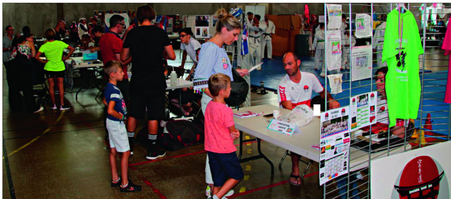
● Le forum a accueilli un public nombreux à la recherche de nouvelles activités à pratiquer.