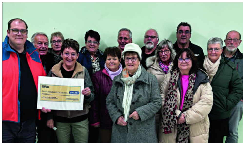
● Remise du chèque de la somme collecté avec les bénévoles.

● Seconde initiative : Le marché de Noël...2024 au gymnase Auguste Delaune.