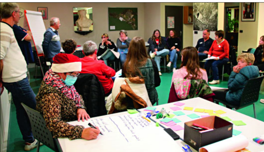
● Réflexion sur les thématiques choisies.