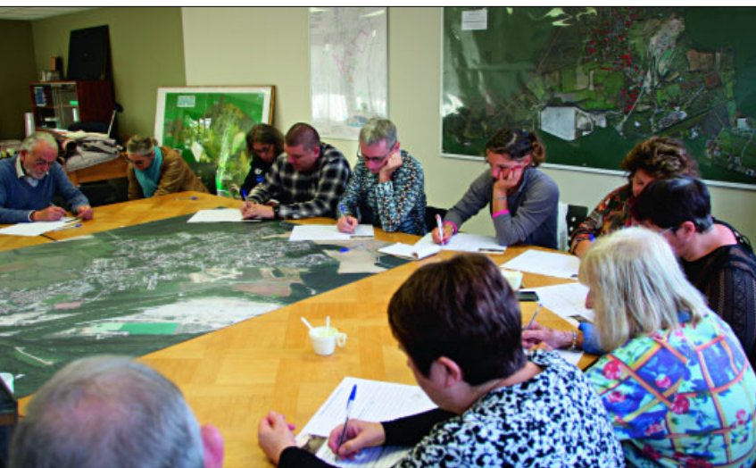
● La carte du territoire est étudiée par le collectif.

● La deuxième phase d'animation a eu lieu, le 25 octobre, elle avait pour objectif de partager une vision commune pour l'évolution du centre-bourg, à travers des ateliers thématiques, réunissant une pluralité de points de vue différents (élu-es, agent-es, habitant-es), cette étape de réflexion permettra d'aboutir à un plan d'action spatialisé et hiérarchisé, de façon à guider l'action publique dans les années à venir.