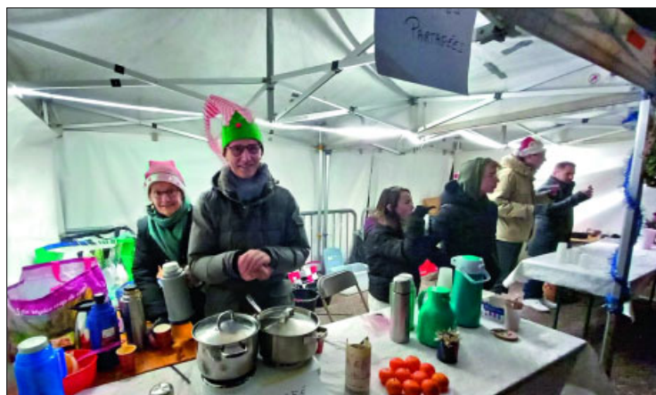
● les membres du Café des Ami-es ont offert la soupe au public.

● En parallèle de l'événement, une rencontre intergénérationnelle s'est déroulée dans l'enceinte de l'école maternelle. Des chants de Noël avaient été préparés par les élèves, dans le but d'offrir un joli concert aux résident-es de la maison de retraite de Tavaux. Les enfants et leurs invité-es ont partagé le goûter ; un joli moment très convivial et émouvant.