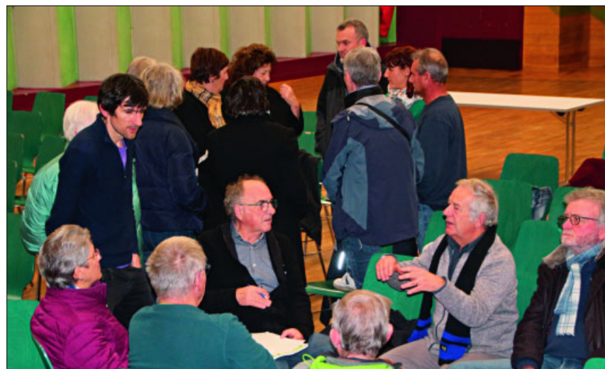
● les premières actions se dessinent.