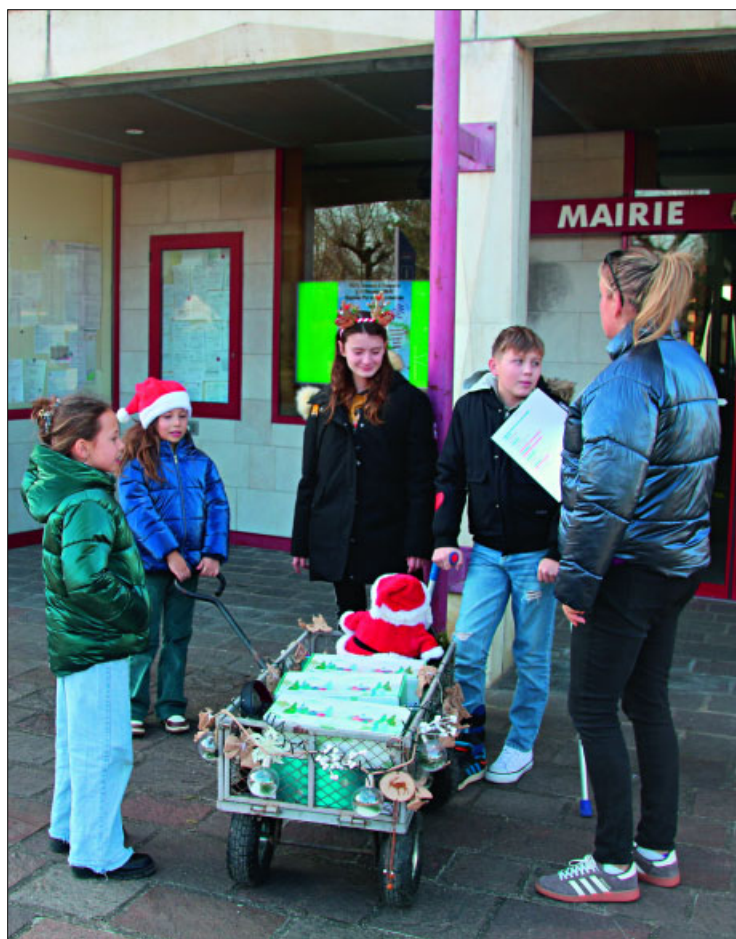
● Distribution des colis par le Conseil Municipal des Jeunes.

● Deux-cent-cinq colis ont été distribués aux personnes âgées de plus de 70 ans . Les résidents et résidentes des maisons de retraite n'ont pas été oublié-es, car dix-neuf sachets de confiserie leur ont été attribués.