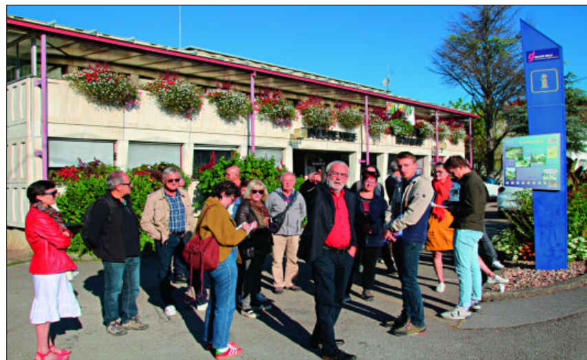
● Le diagnostic urbain « en marchant » apporte une touche concrète à la concertation.