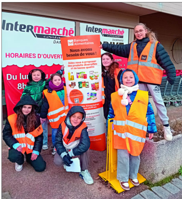
● Les jeunes du CMJ se sont bien investi-e-s.

● À Damparis, les membres du CCAS, des bénévoles et des membres du Conseil Municipal des Jeunes, se sont mobilisé-e-s les 22 et 23 novembre devant l'Intermarché de Damparis pour la collecte de la Banque Alimentaire. De nombreuses denrées alimentaires, hygiène et entretien ont été récoltées. Cette collecte permet à différentes associations et également à l'épicerie sociale de Damparis, d'aider les personnes en situation de précarité. Remerciements aux personnes impliquées et aux généreux-ses donateurs et donatrices.