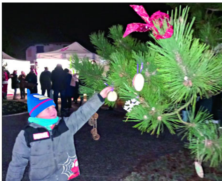
● Plus de 220 décorations ont été fabriquées par les bénévoles et par les enfants du centre de loisirs.